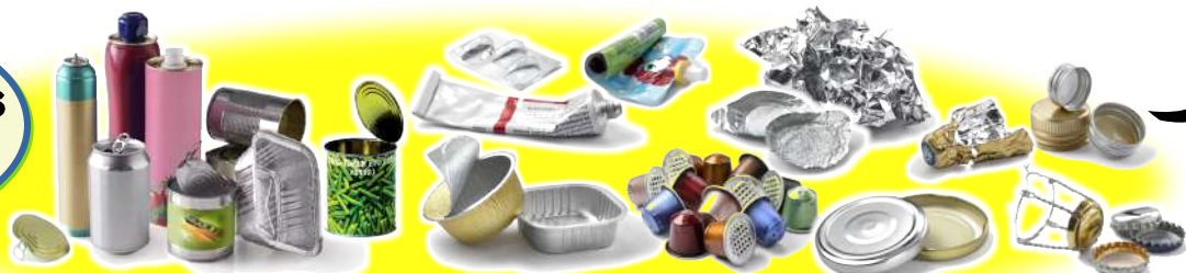
Aérosols, boîtes de conserve, canettes, dosettes de café en aluminium, papier aluminium, opercules, capsules, gourdes compote