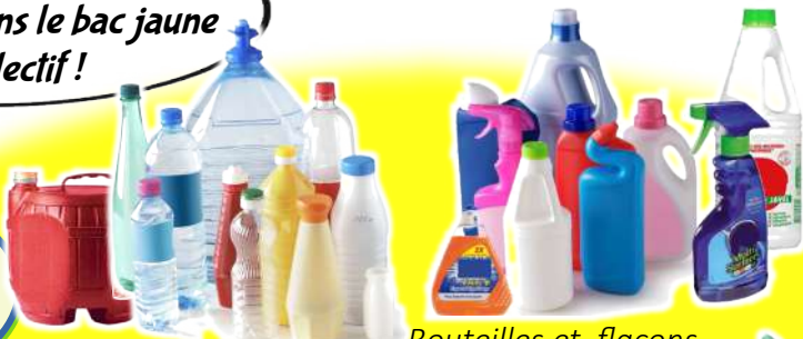
Bouteilles et flacons (alimentaire, entretien et hygiène)