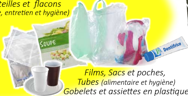
Films, Sacs et poches, Tubes (alimentaire et hygiène) Gobelets et assiettes en plastique