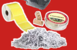
Papier déchiqueté, Photos, Papier peint Bobines, Éléments en bois