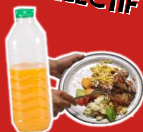
Restes de repas Emballages non vides