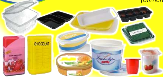
Pots et Barquettes