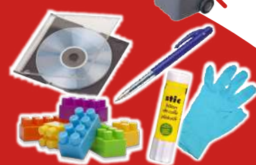
Objets en plastique, jouets